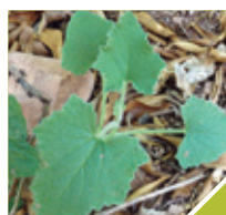
Pepinillo del diablo