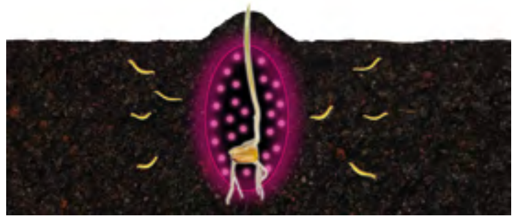
Tras la siembra