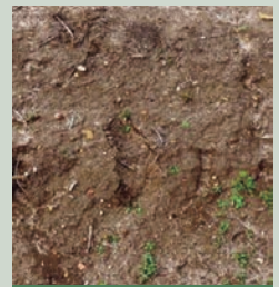
Malas hierbas en dos hojas