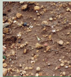
Malas hierbas en punto verde

Para obtener la mejor eficacia, aplicar Ruedo® con el terreno en tempero o cuando se esperen lluvias tras la aplicación.