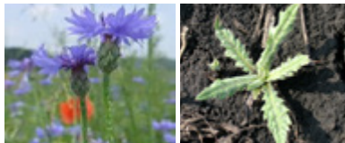
Azulejos y Cardos