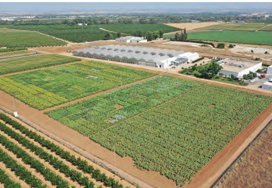
(Imagen del Centro Tecnológico de Investigación de Corteva Agriscience en la actualidad)

Con una superficie de invernaderos de 10.000 m 2 y cerca de otros 1.500 m 2 de laboratorios, el Centro Tecnológico de Investigación de La Rinconada (Sevilla) se posiciona como la instalación más importante de Europa en su género, orientada al cultivo del girasol. Se trata de una zona agrícola con suelos fértiles y disponibilidad de riego que, por sus condiciones climatológicas, es idóneo para cultivos intensivos, extensivos y de invernadero.